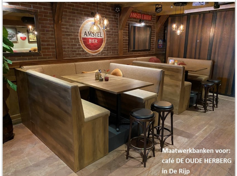
Maatwerkbanken voor: café DE OUDE HERBERG in De Rijp

HERSTOFFEREN VAN: BOTEN, CARAVANS, CAMPERs, ANTIK, BANKSTELLEN, STOELN MAATWERKPROJECTEN ZOALS BANKEN OPVULLEN VAN STOELN EN BANKEN